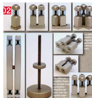
Différents modèles d'agrafes pour créer le montage que vous souhaitez.