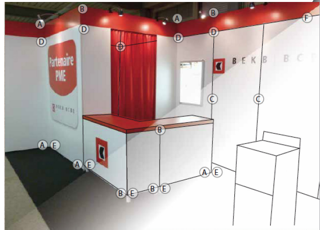
Types d'agrafes utilisées pour le montage de ce stand